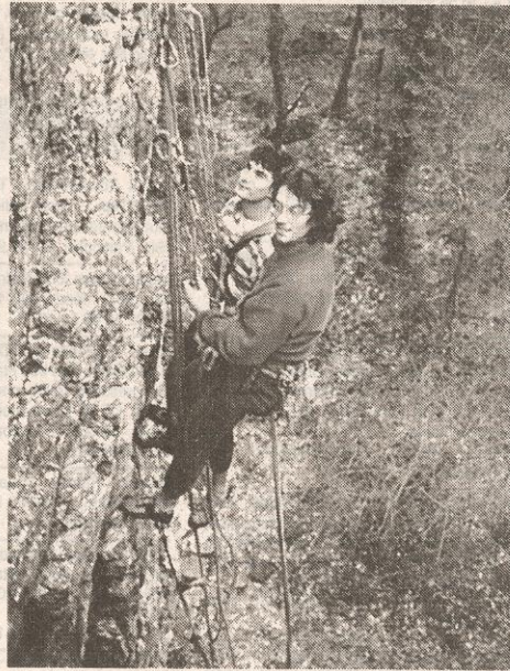
Pratiquer un sauvetage en paroi est une situation que doit savoir gérer tout cadre bénévole

Le Club Alpin Français, qui s'est transformé en 1997 en fédération multisport, regroupe environ 5000 licenciés dans l'ouest. C'est pour encadrer les nombreux grimpeurs de ses clubs que vient d'être lancée sur le site de Saut de Rolland près de Fougères (Ille-et-Vilaine) une première session de formation d'initiateurs bénévoles d'escalade CAF, organisée par le comité départemental 35.